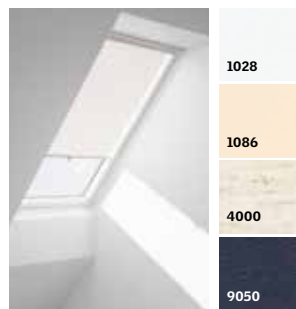
Рулонная штора на крючках RHL