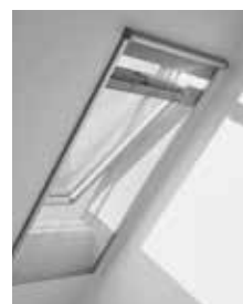
Москитная сетка ZIL