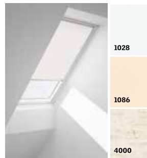
Рулонная штора на направляющих RFL