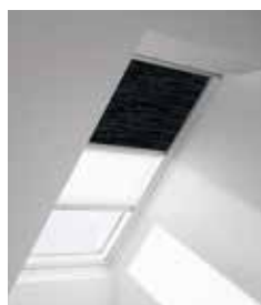
Затемняющая штора «Ду» DFD