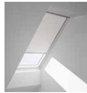
Затемняющая штора «Сиеста» DKL